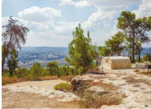
קבר שמשון . סיפור שנמצא בבסיס התרבות שלנו