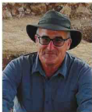
פרופ' אהרון מאיר