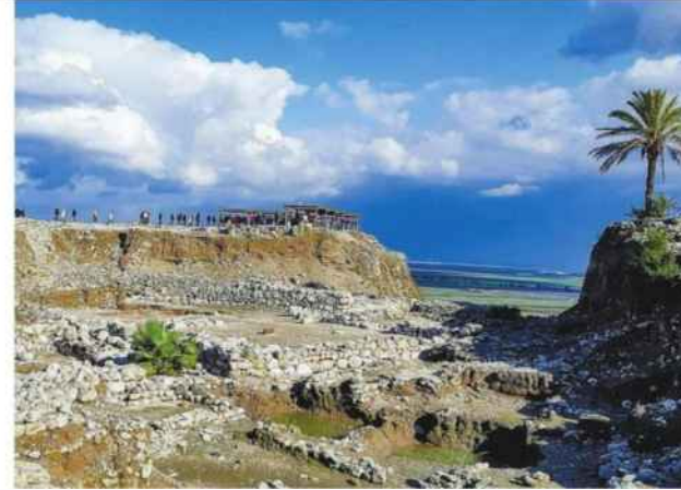
מגידו . מסורת שהתפתחה באיחור