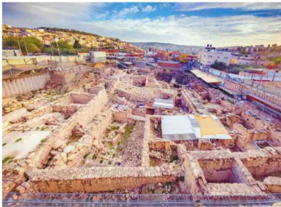
עיר דוד. בשער: תל עזקה. חלק מרשימה ארוכה של אתרים עם עבר "תנ"כי"