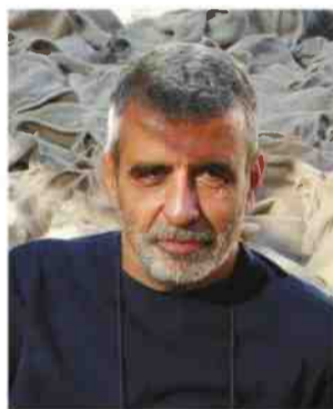
פרופ' ישראל פינקלשטיין