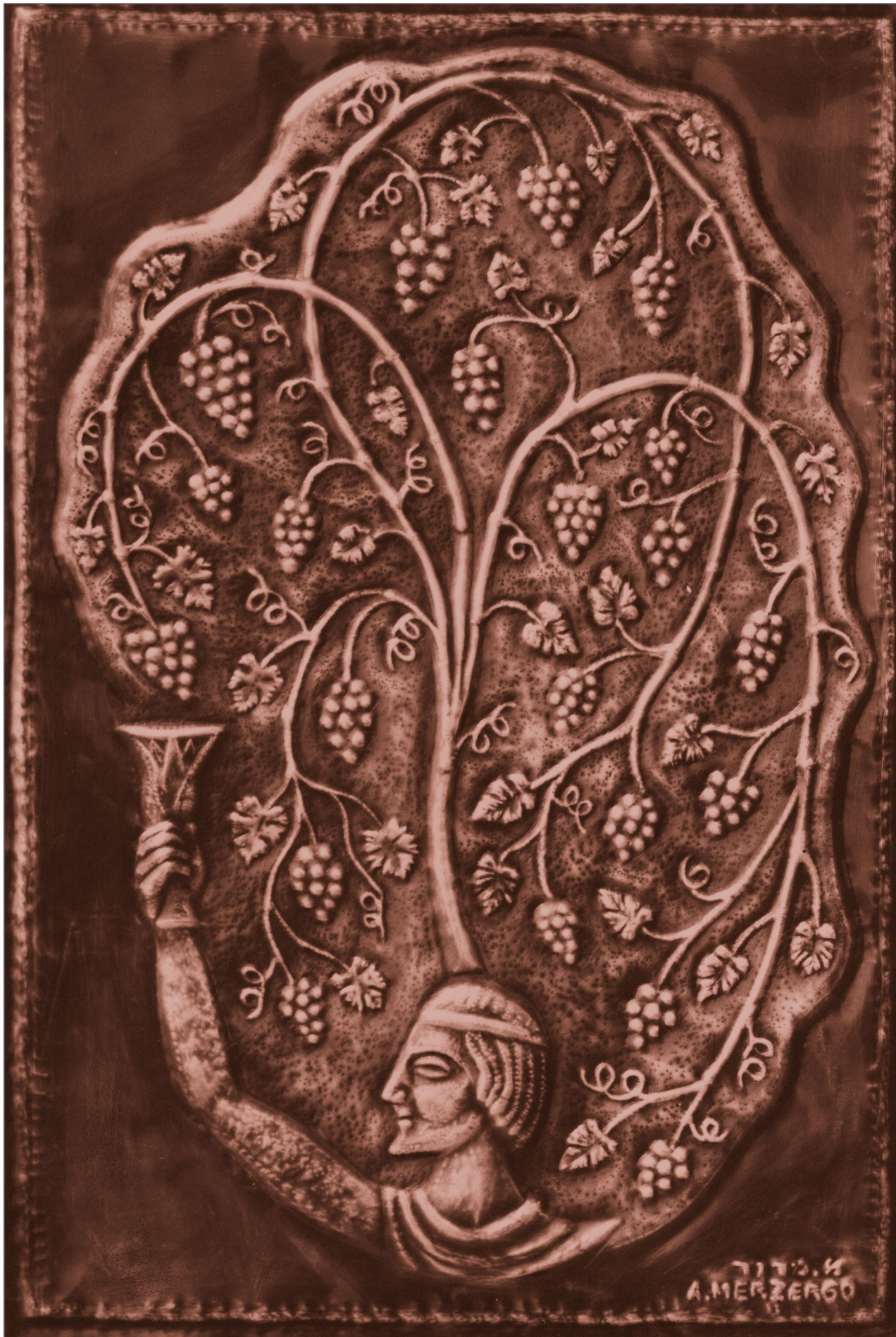
ניצוב: סטודיו אורג

אוניברסיטת בר-אילן הפקולטה למדעי היהדות המחלקה לאמנות יהודית