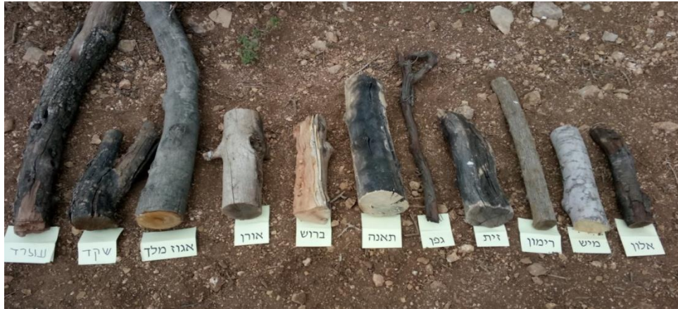
מיני העצים אשר שימשו לניסוי